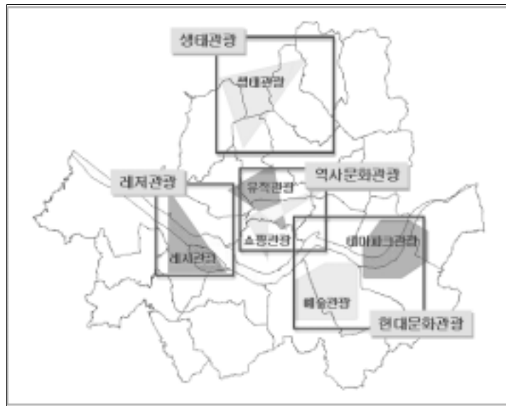
<그림 3> 테마별 관광자원개발 구상

역은 생태관광지역으로서의 특성을 지니고 있는 것이다. (<그림 3> 참조)