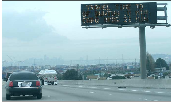
통행시간 정보가 제공되는 변동 메시지 표지판(VMS)