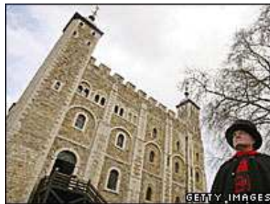
900년 역사를 자랑하는 런던탑

( news.bbc.co.uk/1/hi/england/london/6432685.stm )