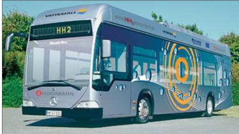
함부르크에서 운행되고 있는 연료전지 버스