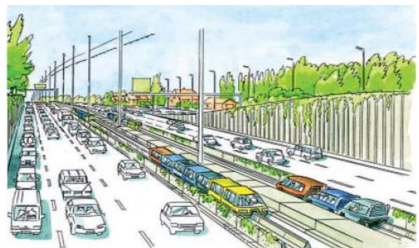
Using the Rapid Urban Flexible transport system, vehicles heading into major cities would have the option of driving directly from road to monorail

오늘날 대중교통시스템은 환경에 더 유익하고, 자가용은 개인의 프라이버시 보장에 더 유용하다. 그러나 자가용은 공해유발과 심각한 교통혼잡을 일으키는 주요한 요인이기도 하다. 이 2가지 교통수단의 장점만을 결합한 것이 'RUF 교통시스템(Rapid Urban Flexible Transport System)'이다. 저렴하면서 환경친화적이고 프라이버시가 보장되는 대중교통수단인 'RUF 교통시스템'은 현재 세계 전역에서 주요한 이슈로 떠오르고 있다.