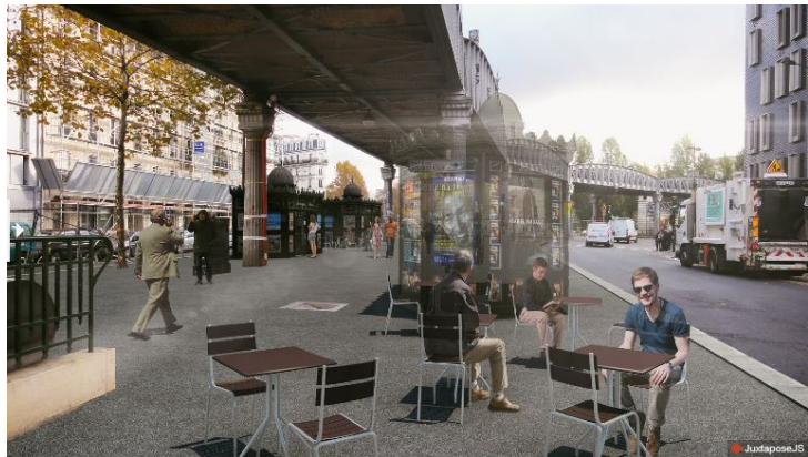
[그림 1] 지하철 고가도로 아래 도보공간 개선방안(위: 현재 모습, 아래: 계획안)