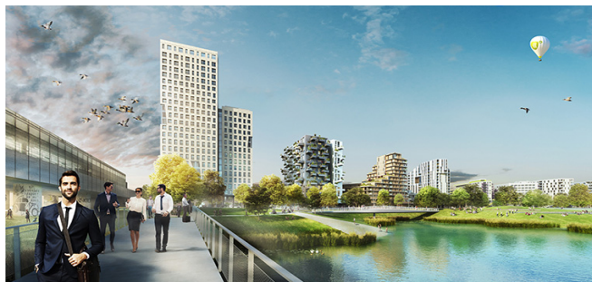
[그림 3] 아스페른 지구 확장개발 계획안 1