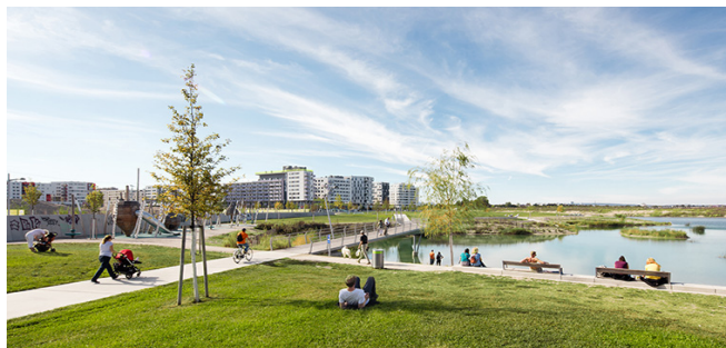
[그림 2] 아스페른 지구 내 호수공원