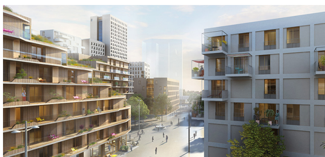
[그림 4] 아스페른 지구 확장개발 계획안 2