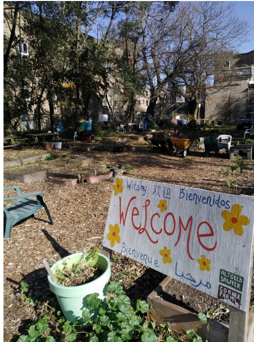
[그림 1] 시카고시 내 도시농업 프로젝트 중 하나인 시민 텃밭 전경

https://www.americaninno.com/chicago/how-chicago-became-a-leader-in-urban-agriculture/