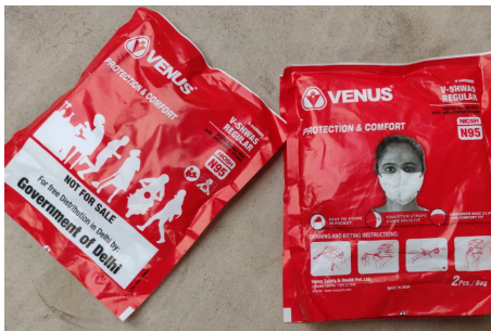
[그림 1] 학교 배부용 마스크