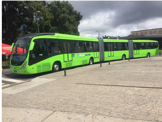
[그림 1] 도입 모델로 검토되고 있는 Metis社의 다관절 전기버스차량