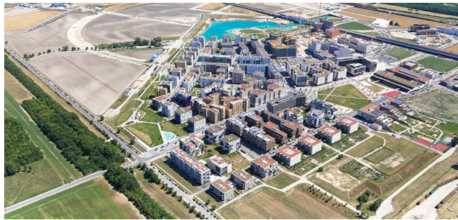
[그림 1] 현재 아스페른 지구 전경