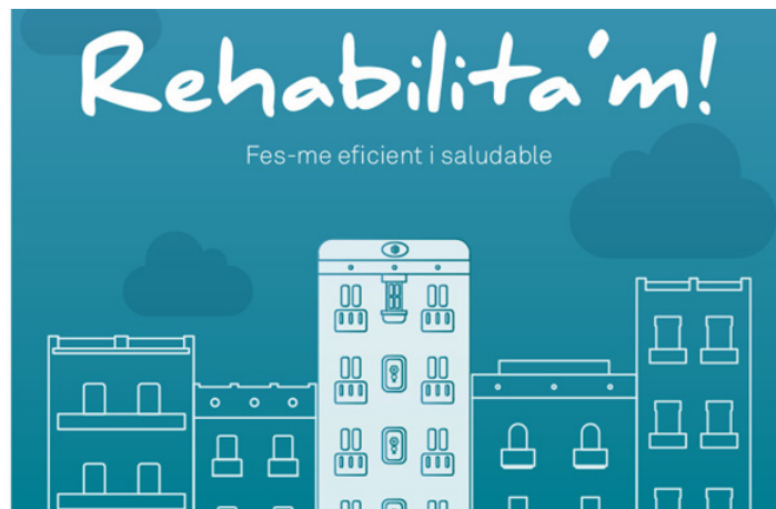
[그림 1] 바르셀로나시 건물에너지 효율성 개선을 위한 안내서 표지

http://ajuntament.barcelona.cat/ecologiaurbana/es/noticia/ya-estza-disponible-la-guza-arehabilitame-hazme-eficiente-y-saludable