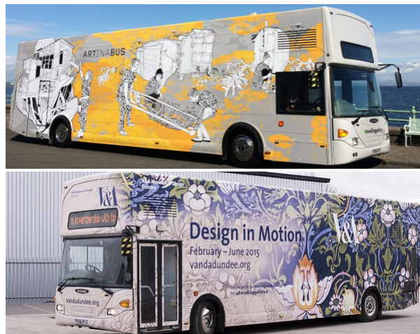
[그림 1] 전시종류에 따라 디자인이 달라지는 이동식 갤러리 외관