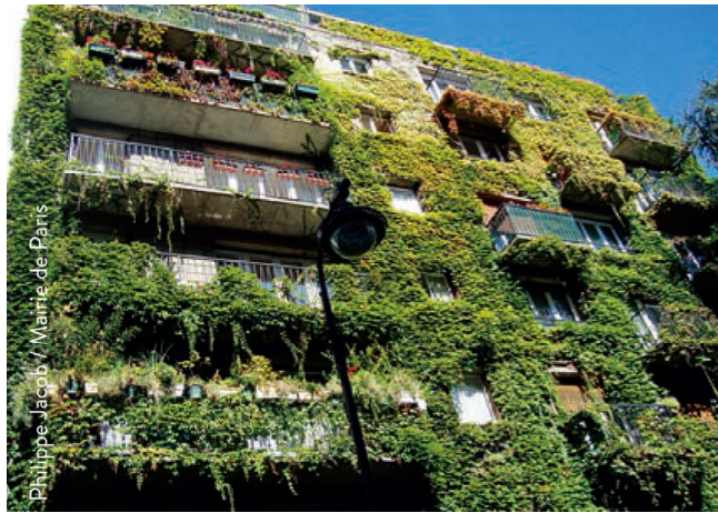
[그림 1] 건물 녹색화의 예시