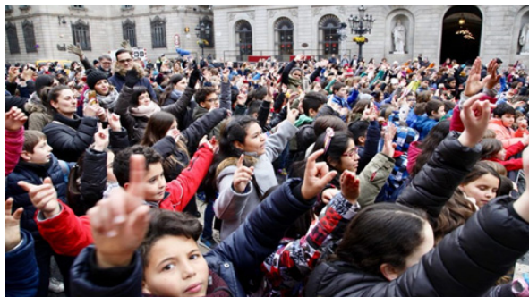
[그림 1] 더 많은 놀이공간의 조성을 요구하는 ‘어린이 선언’