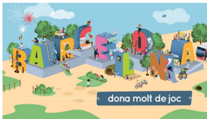
[그림 3] 바르셀로나 놀이공간 조성계획 이미지

http://ajuntament.barcelona.cat/ecologiaurbana/es/noticia/mzas-juego-infantil-para-una-ciudad-con-mzas-vida