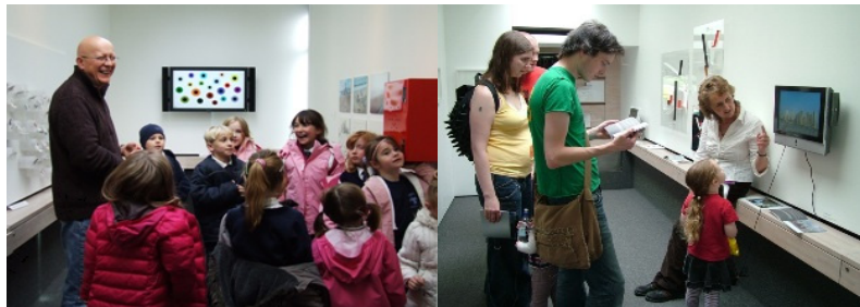
[그림 3] 예술교육과 체험프로그램

http://www.travellinggallery.com/forteachers