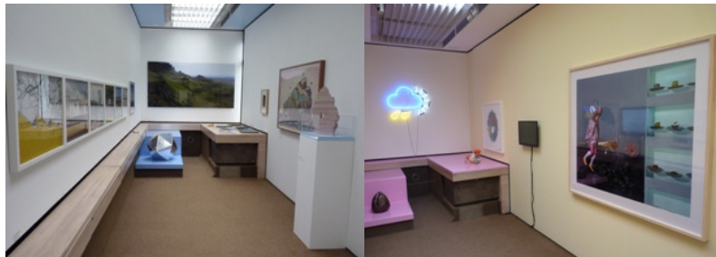
[그림 2] 내부 전시 모습