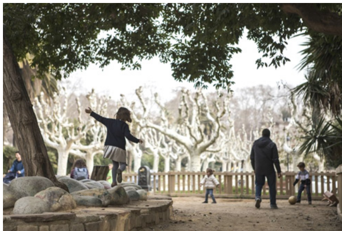
[그림 2] 새로운 형태의 놀이공간 구상도