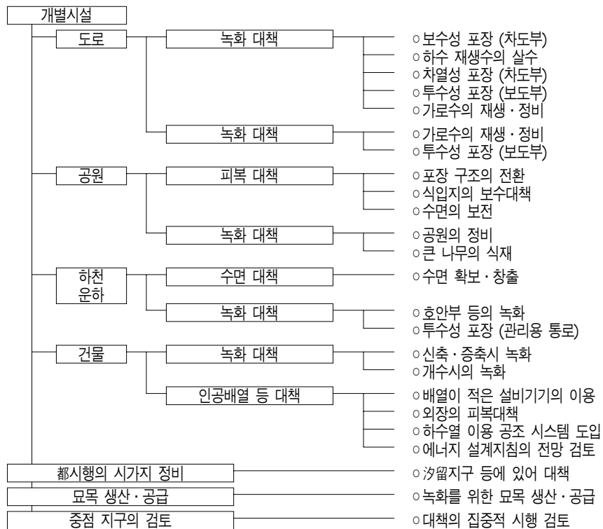
[그림 3] 도시열섬 완화를 위한 동경도 선도대책