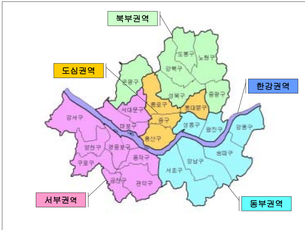
[그림 2] 서울 자연자원관리와 생태관광을 위한 권역 설정