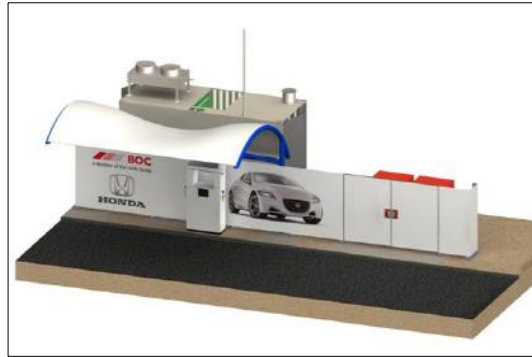
【수소연료 충전소 모습】