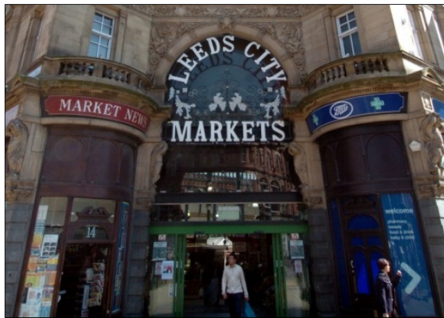
【리즈 중심가에 위치한 커크게이트 시장 입구】

( www.bbc.co.uk/news/uk-england-leeds-14186445 )