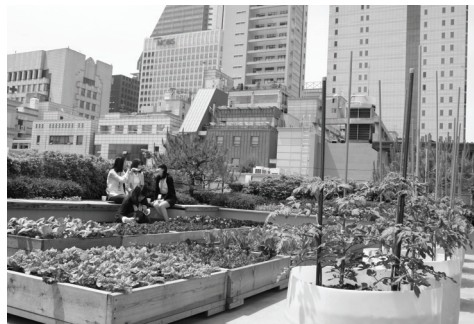
[그림 3] 에이제이월드 옥상농원