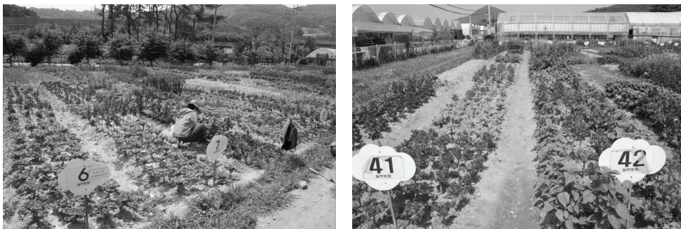
[그림 1] 서울시 실버다둥이 농원

자치구별로 살펴보면 강동구, 도봉구, 서초구 순으로 텃밭농원이 많이 운영되고 있다. 지역의 특성에 따라 임야 및 자연녹지가 많은 자치구를 중심으로 서울 외곽주변에 활성화 되고 있다.