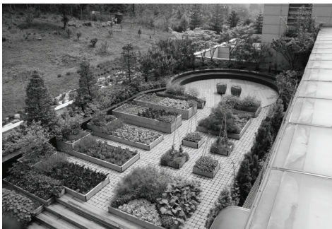
[그림 2] 서울시 농업기술센터 옥상녹원