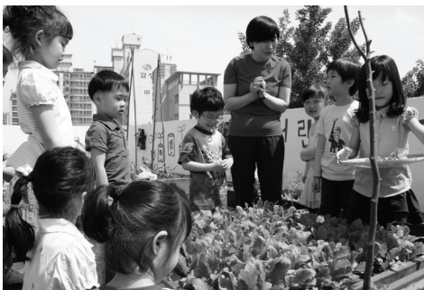
[그림 4] 한내들 어린이집 옥상농원