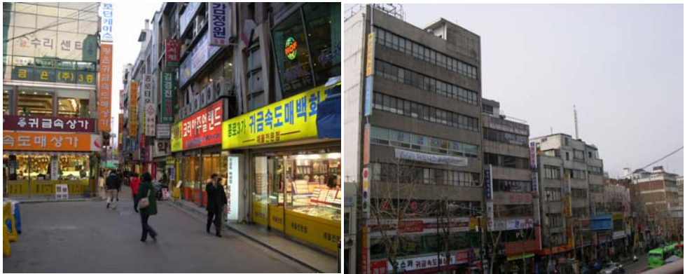
<그림 3> 종로 귀금속·보석 거리 모습(봉익동 귀금속·보석 상가(좌), 돈화문로(우))