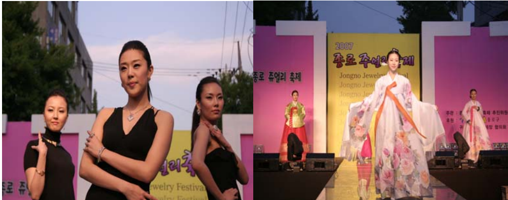
〈그림 2〉 종로 귀금속·보석 축제 모습(주얼리패션쇼(좌), 한복과 주얼리의 만남(우))