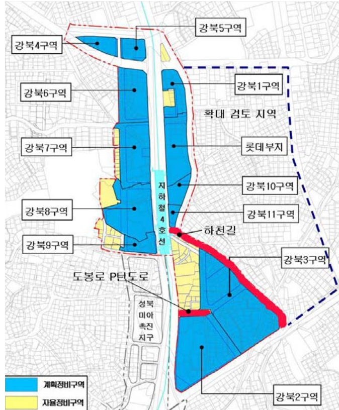
<그림 3> 미아균형발전촉진지구 세부 위치도