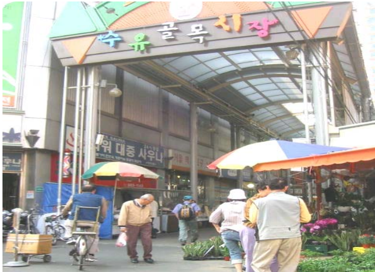
<그림 4> 수유시장