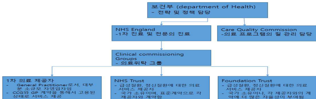
<그림 1 영국 보건의료서비스 체계>