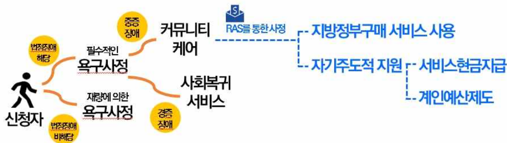
<그림 3 돌봄 서비스 절차>