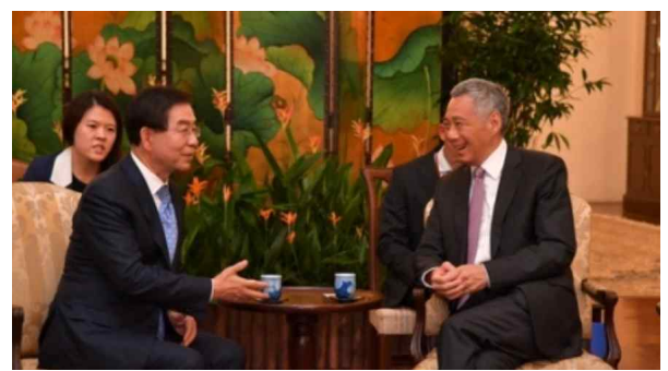
서울시장-싱가포르 리선룡 총리 회담