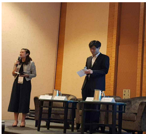
서울연구원-CLC 공동연구 발표