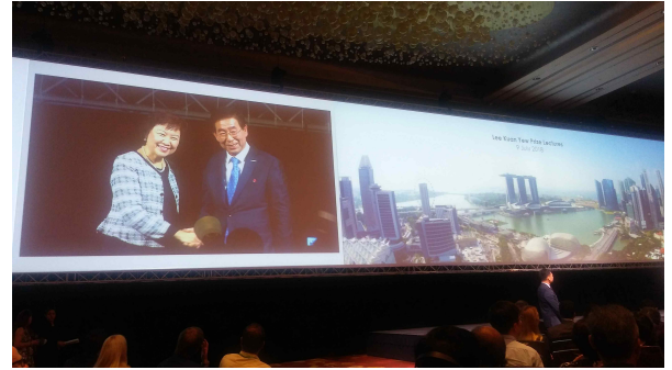
서울시장 리관유 상 수상