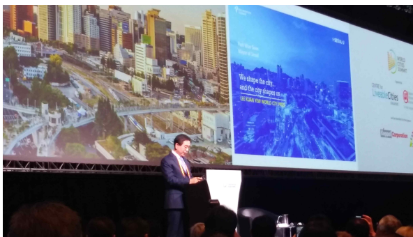
수상도시 소감 및 특강발표