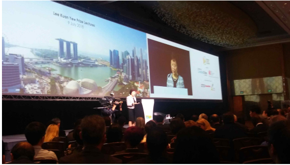
리관유 세계도시상 수상도시 (서울) 발표