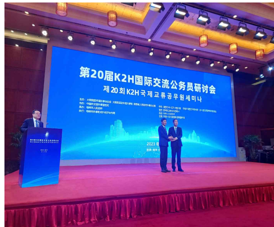
〈사진 4〉 K2H국제교류공무원세미나