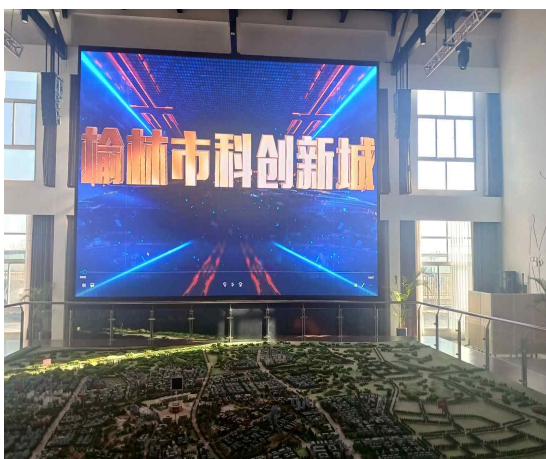
〈사진 11〉 위린과학혁신 신도시