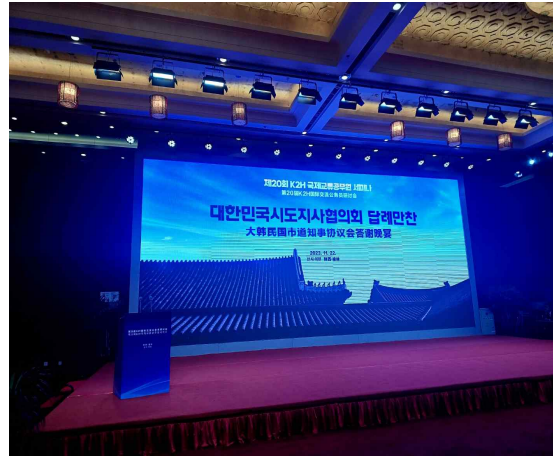
〈사진 2〉 답례만찬