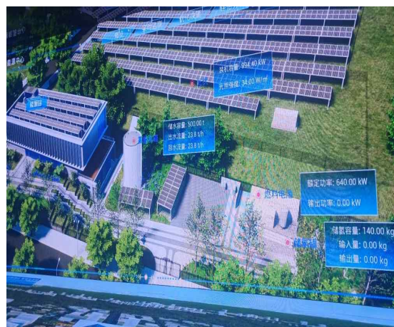
〈사진 12〉 위린과학혁신 신도시