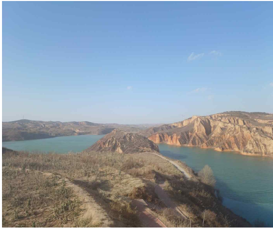
〈사진 7〉 마황량황토지질공원