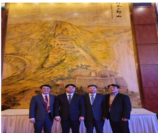
〈사진 5〉 K2H국제교류공무원세미나