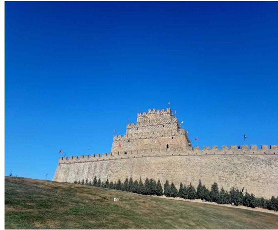
〈사진 8〉 진북대 만리장성