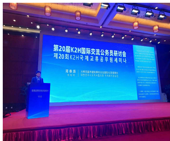
〈사진 6〉 K2H국제교류공무원세미나