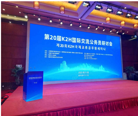
〈사진 3〉 K2H국제교류공무원세미나