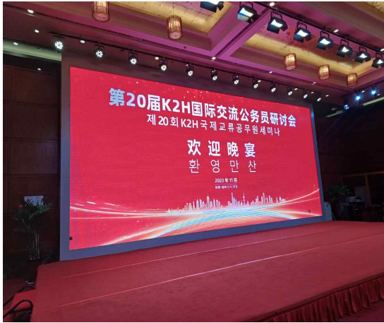
〈사진 1〉 환영만찬