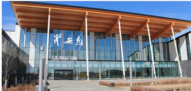
[그림 1] 에드먼턴 시내의 한 레크리에이션 센터