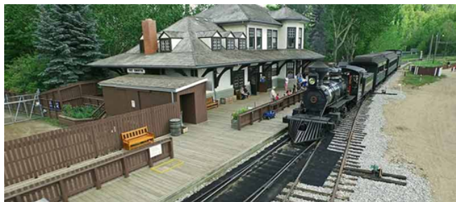
[그림 2] 포트 에드먼턴 파크