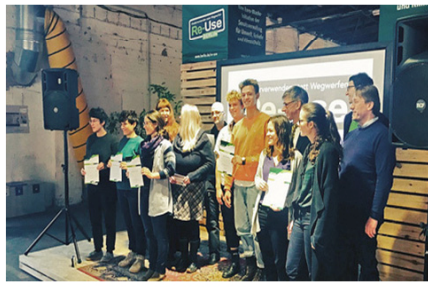
[그림 2] 재활용 아이디어 대회 시상식