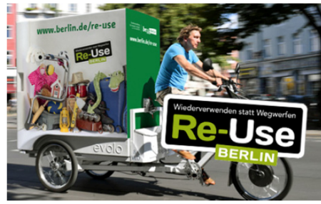
[그림 1] 리우즈 베를린 중고물품 수집 바이크