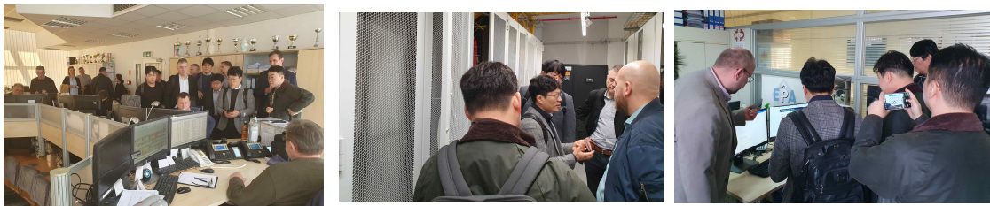
<그림 3> 스마트시티 관련기관 방문

자료제공 및 문의처: 미래융합전략실장 선임연구위원 김원호 (02-2149-1131)