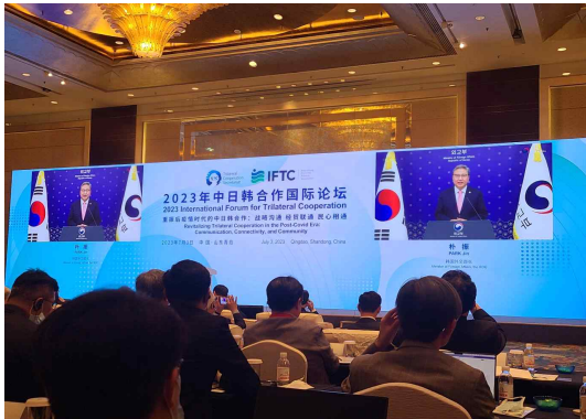
▲박진 외교부 장관 축사