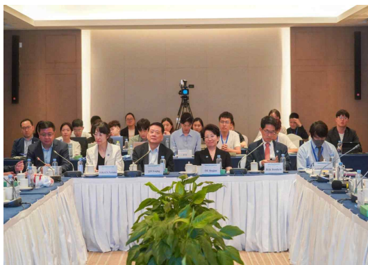
▲ 한중일 청년학자포럼