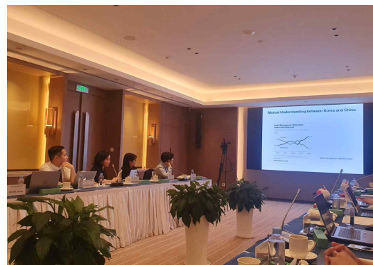
▲ 세션3 출장자 발표 및 토론