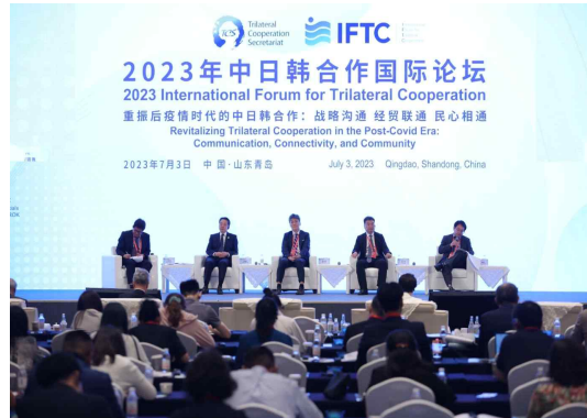
▲제3세션: 지역사회 교류의 관점에서 보는 상호인식의 개선