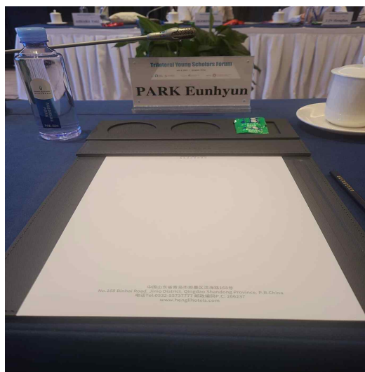
▲ 세션3 출장자 발표

자료 제공 및 문의처: 도시모니터링센터 박은현 연구원 (02-2149-1084)