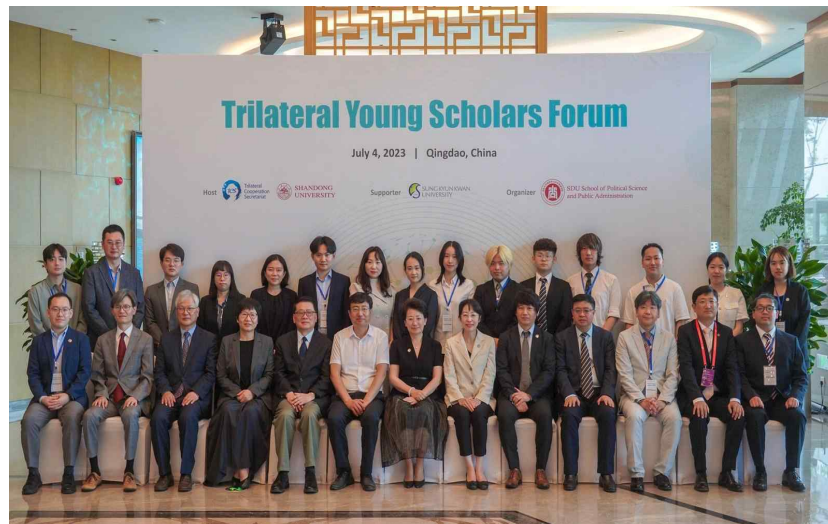
▲ 한중일 청년학자포럼 참가자 그룹 포토