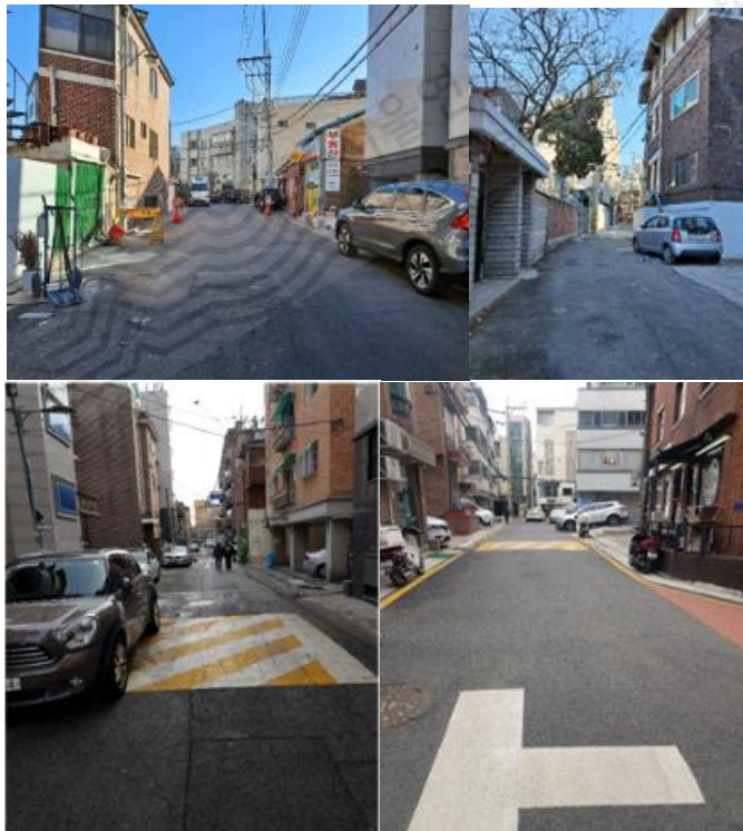
생활도로 예시 이미지