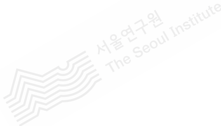
[그림 4] 시내버스 서비스 만족도 2019년 결과와 2018년 결과의 비교