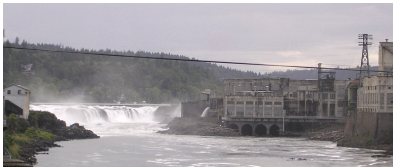
그림. 윌래밋 폭포 전경