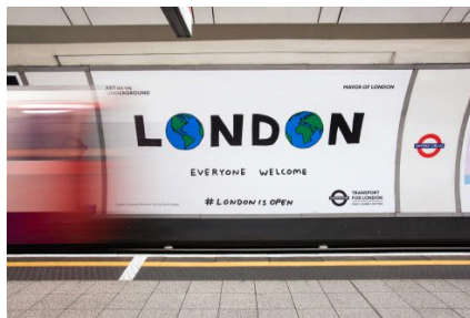
그림. (좌) Everyone Welcome, 데이비드 슈리글리(David Shrigley), 2016