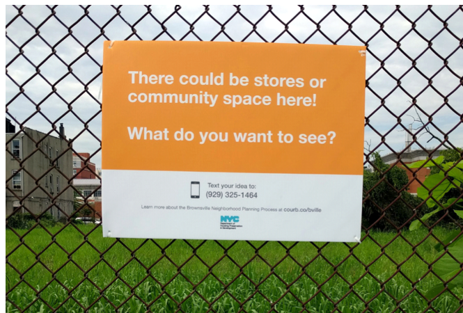
그림. 현장에 설치된 간판.

“이 자리에는 상점이 들어올 수도, 커뮤니티 공간이 들어올 수도 있습니다! 무엇을 원하시나요?”