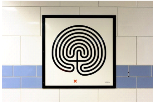
그림. Labyrinth, 마크 웰링거, 그린파크 역, 2013