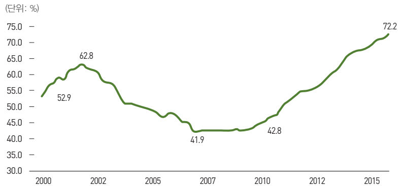
〈그림 1〉 서울 아파트 전세/매매가격 비율 추이(2000.1~2015.10)