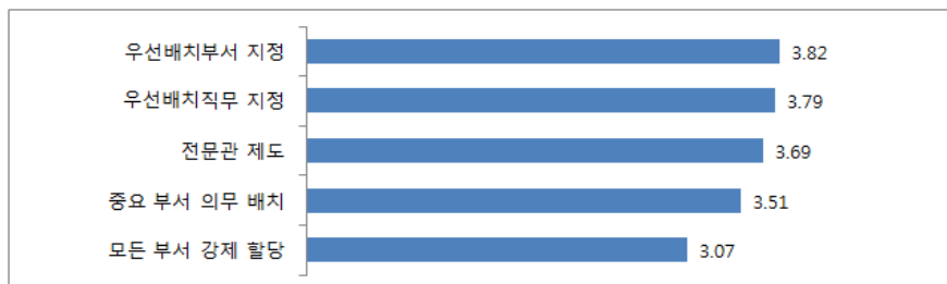
그림 2 장애인공무원 직무배치 방식에 대한 선호도