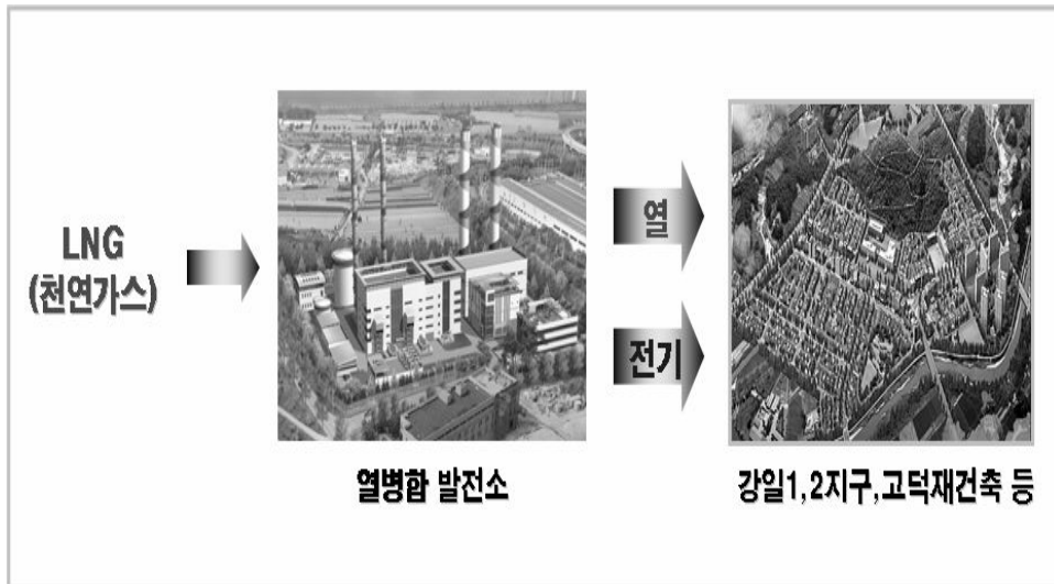
〈그림 2〉 집단에너지 공급 개략도

새로운 에너지 공급방식이라 할 수 있는 집단에너지 공급사업(CES:Community Energy Supply System)인 지역난방이 공급되면 주민들의 난방비 부담도 줄어 가정경제도 살리고 대기환경이 맑아져 지구환경도 살릴 수 있는 일석이조의 효과를 보게 될 뿐 아니라 아파트 단지들의 가치가 더욱 업그레이드 될 전망이다.