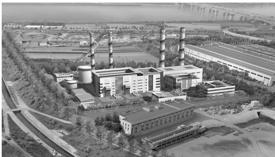
〈그림 4〉 집단에너지 공급시설(열병합발전소) 조성 전·후 전경